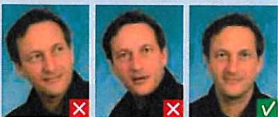
Kigger væk Hoved skævt