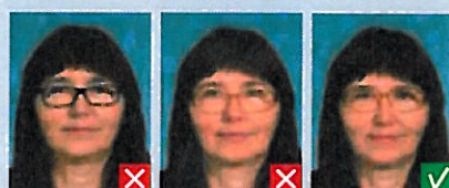
Stel dækker øjne