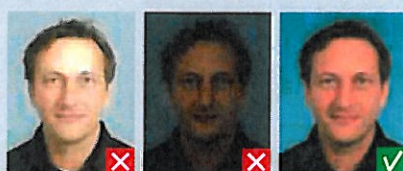
For lyst, skarp blitz