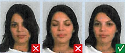
Øje dækket af hår

Baggrunden skal være uden motiver og i ensartet lys farve, f.eks. lys blå eller lys grå.