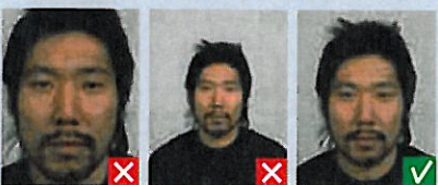
For tæt på

Blikket skal være rettet mod kameraet, øjnene helt synlige og munden lukket.