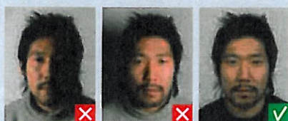
Skygge på ansigt